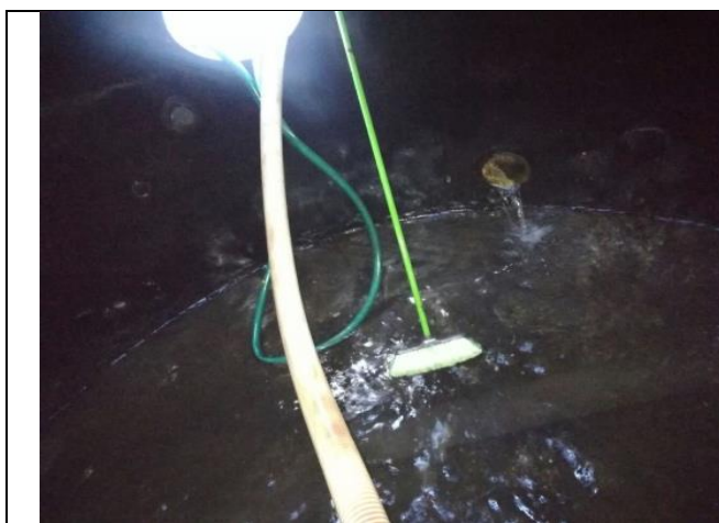
Limpieza paredes interiores de la cuba y piso utilizando escobilla y agua a presión